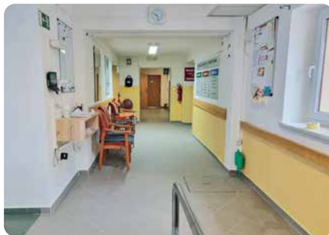
Při náročné rekonstrukci hlavní chodby staré koberce nahradila nová dlažba.

Během prvního čtvrtletí letošního roku jsme zavedli mnoho nových aktivit. Proto si pojdme některé z nich blíže představit. A s nimi pochopitelně představíme i jejich protagonisty, lidi, kteří neváhají a obětují svůj volný čas pro nás, abychom s nimi mohli strávit příjemné a užitečné chvíle.