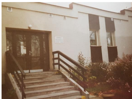
Vstup do Domova před rokem 2007

prádelna. V roce 2001 byla provedena rekonstrukce a modernizace kuchyně. V letech 2001 a 2005 byly pro zlepšení nabídky ubytování provedeny dvě stavební úpravy - půdní vestavby na pavilonech A a B, kde vzniklo 14 jednolůžkových pokojů s částečně bezbariérovým sociálním zařízením. V roce 2007 byla vybudována a zkolaudována přístavba vstupní části Domova a centrální recepce.