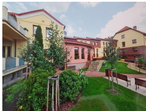
Současná podoba hlavního vstupu do Domova

Poslední a nejrozsáhlejší rekonstrukce se týkala nejstaršího pavilonu C a byla zahájena dne 17.7.2008. Konkrétně rekonstrukce zahrnovala především vytvoření plně bezbariérových jedno a dvoulůžkových pokojů s ošetrovatelskými lůžky, výměnu oken, zateplení obvodového pláště budovy, výměnu střešní krytiny, výměnu evakuačního lůžkového výtahu, rekonstrukci rozvodů TUV, odstranění akumulčních nádob, rekonstrukci rozdělovačů topení, instalaci systému měření a regulace. Ukončení těchto rekonstrukčních prací proběhlo na podzim 2009.